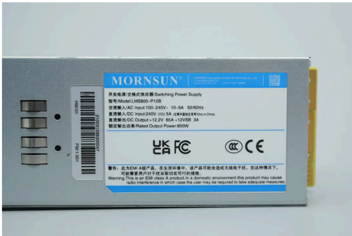
电源机身标签特写